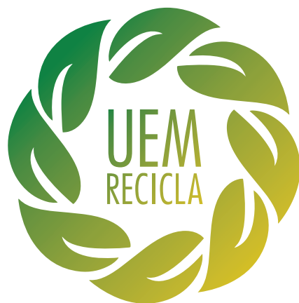
Figura 1. Logotipo UEM Recicla

Com o propósito de consolidar e divulgar uma identidade visual para o projeto UEM RECICLA, foram elaborados pela Creative JR, os seguintes itens: logotipo do projeto, adesivos para as lixeiras, criação de fanpage (UEM Ambiental), criação de placas e banners informativos.