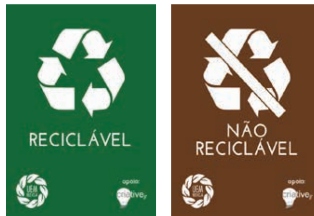
Figura 2. Adesivos para as lixeiras